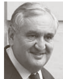
Bauernopfer: Jean-Pierre Raffarin.